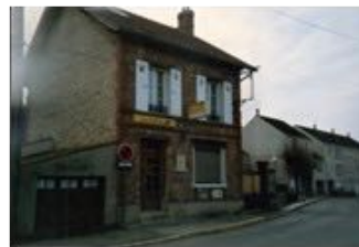
la poste en 1992

Au début des années 2000, comme dans de nombreux villages de France, la poste d'Aulnay est menacée de fermeture. Un accord est trouvé entre les deux parties en 2003.