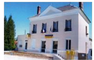
la poste en 2007

En juin 2004, la poste est transférée dans le local de l'ancienne mairie après réaménagement du rez-de-chaussée dont les travaux ont été financés par emprunt. Un nouveau bail de neuf ans a été signé avec la Poste dont le loyer est basé sur les annuités de remboursement.