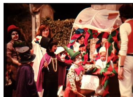
« La Prairie » Circus