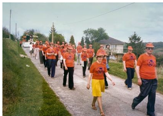
«Les Boules» ASAM