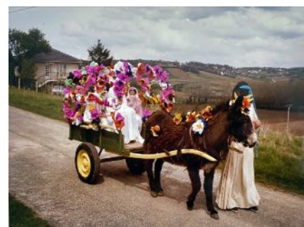
« Nénette »