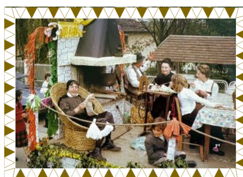
Le premier char du Comité